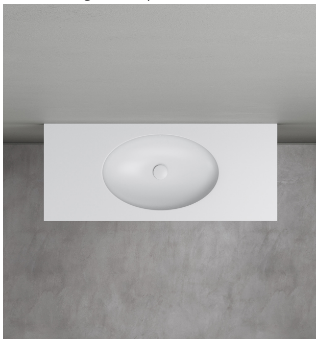
versione integrata al top H2.4

Questa serie di lavabi dalle forme morbide, è realizzata mediante termoformatura delle lastre Corian® DuPont™. Questi modelli sono dotati di piletta ispezionabile di forma circolare con copri piletta in finitura Corian® in tinta. Tutti i modelli possono essere integrati al top o installati in appoggio. L'integrazione permette di realizzare soluzioni monocromatiche o bicromatiche. Tutte le ciotole della collezione Acquapazza sono disponibili solo nelle dimensioni indicate e non sono personalizzabili.